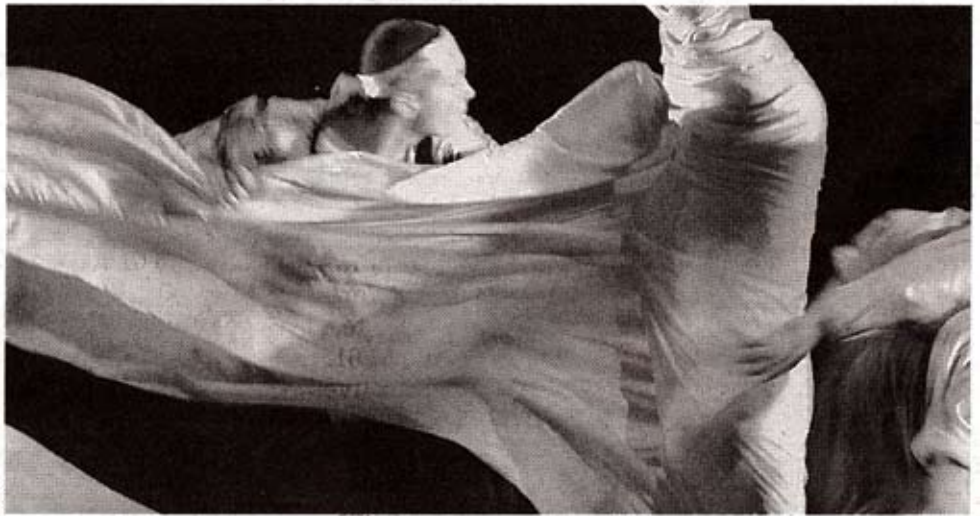
Le roman de Cervantès mis en espace et en geste.

Prennent forme Don quichotte, joué par un coréen, Sancho Pansa, un occidental, et Dulcinée, une japonaise étrange mais intéressante. Mélange de culture, se mêlent les mots un peu répétitifs, ponctuation de l'action qui se rejoignent dans une même expression, celle du corps baignée de langage asiatique. Proposition déconcertante, finement travaillée, la verve chevaleresque de Cervantès s'exprime sans difficulté, les gestes se suffisent à